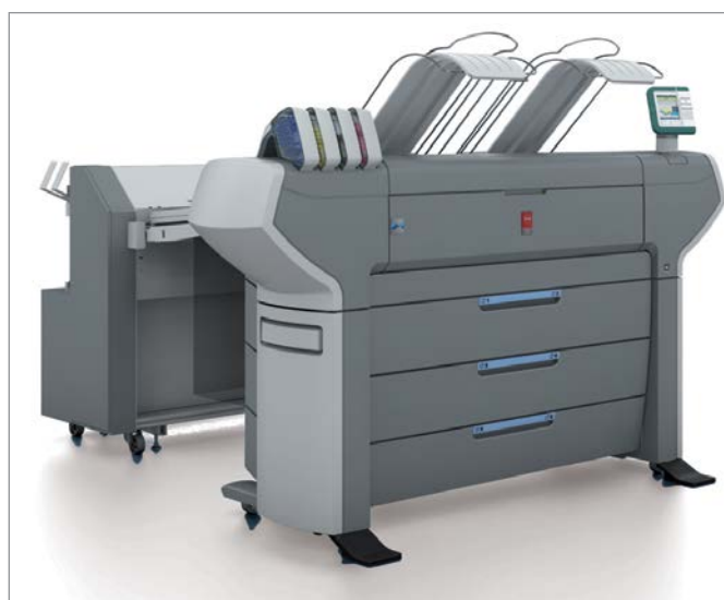
Océ ColorWave 650 + Océ 4311 fuldfoldning