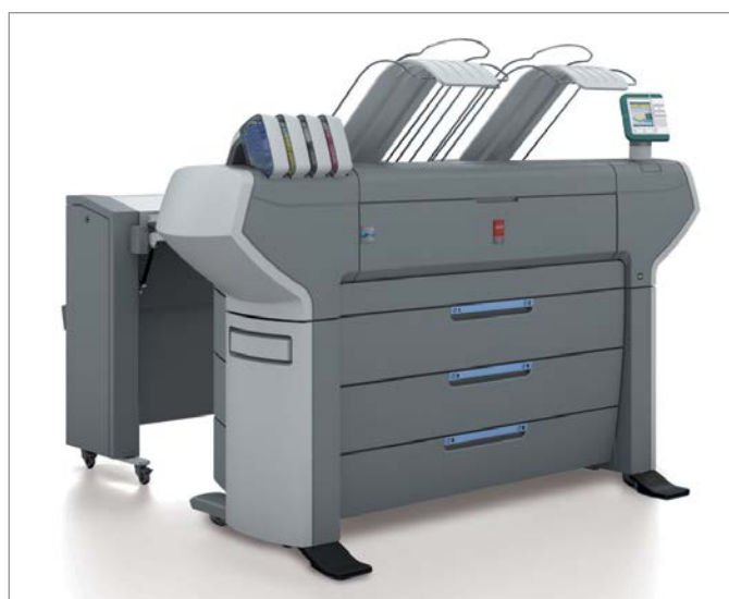
Océ ColorWave 650 + Océ 2400 fanfoldning