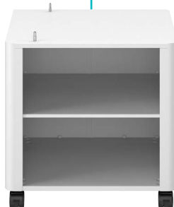
Подставка Plain Pedestal Type - G1