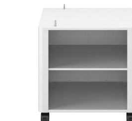
Модуль кассетной подачи Cassette feeding module - AC1 и подставка Plain Pedestal Type - G1