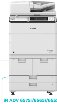
IR ADV 6575i/6565i/6555i