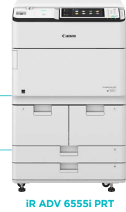
IR ADV 6555i PRT