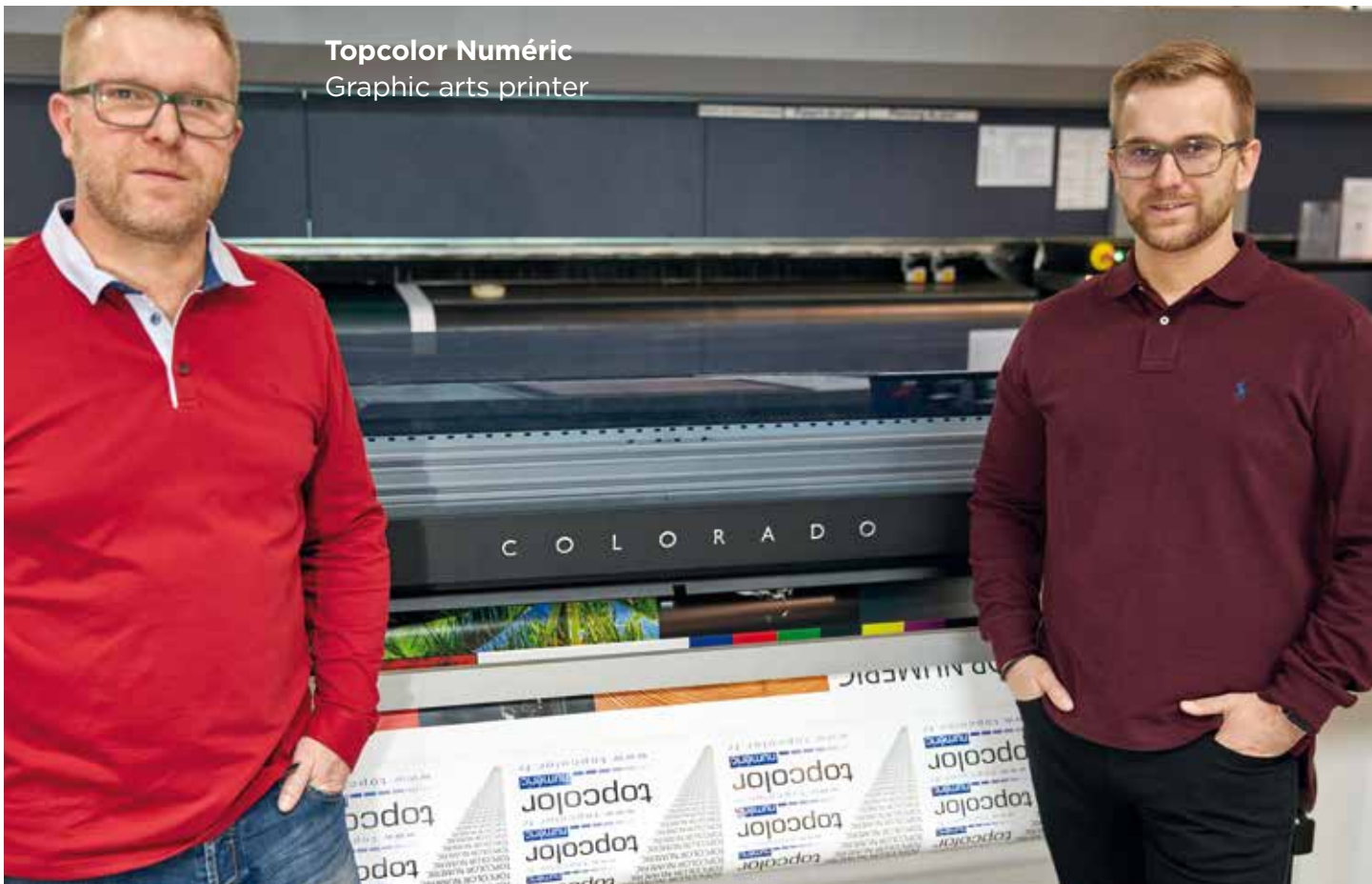
Topcolor Numéric Graphic arts printer