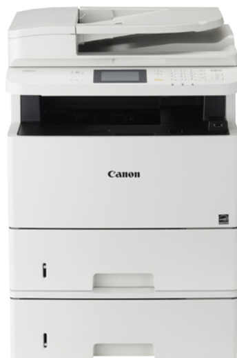
Pääyksikkö ja yksi paperikasettisyksikkö PF-45